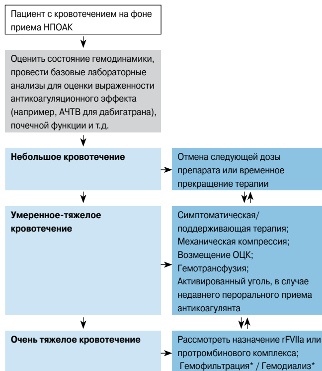
Рис. 2. Тактика ведения пациентов с кровотечением на фоне приема новых пероральных антикоагулянтов (не являющихся АВК). По материалам Samm et al. 2012 [144].

На фоне терапии НМГ антикоагулянтный эффект может сохраняться в течение 8 часов с момента введе-