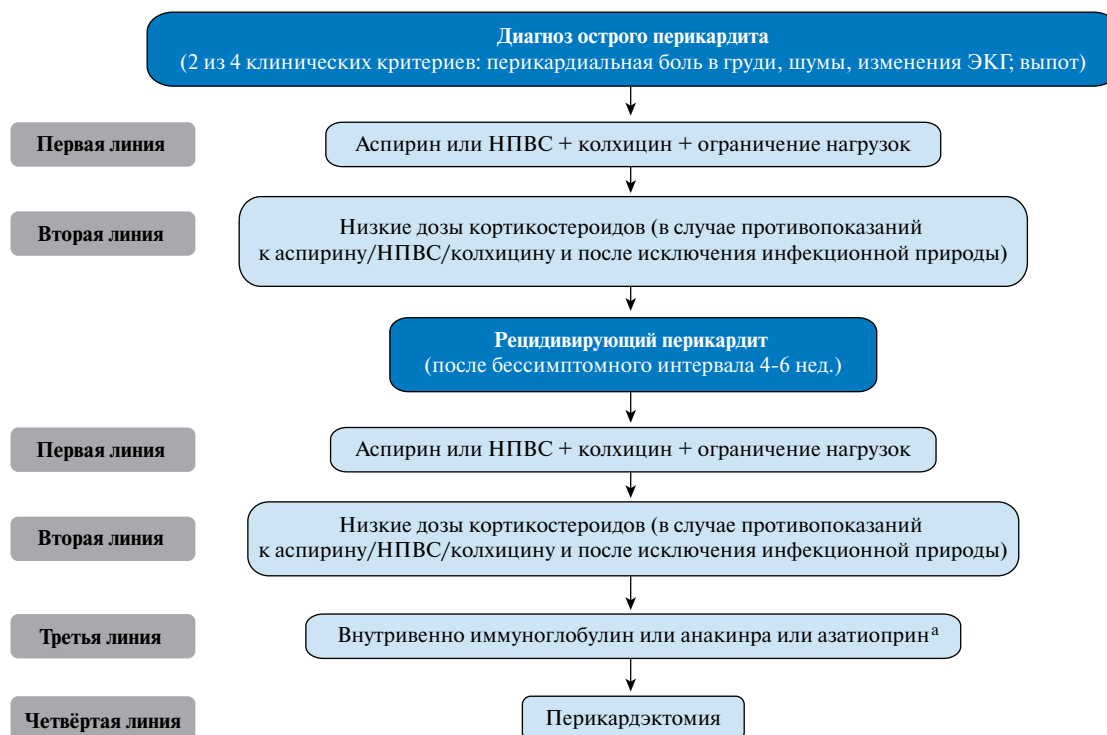
Рис. 2. Терапевтический алгоритм для острого и рецидивирующего перикардита (см. текст).

После получения полного ответа на лечение, постепенно отменяются препараты одного класса, после чего постепенно отменяется колхицин (в наиболее сложных случаях, несколько месяцев). Рецидивы возможны после отмены каждого препарата. Постепенная отмена каждого следующего препарата должна происходить, если сохраняется нормальный уровень СРБ и отсутствует симптоматика [5, 6, 47, 56]. Рабочая группа не рекомендует использование